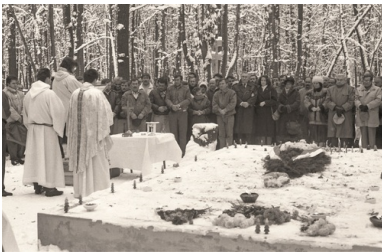
Msza św. 1 listopada 1991 r. przy grobie polskich oficerów w Charkowie-Piatichatkach.

Kilkanaście dni po pochówku pracownicy Energopolu przyjechali na miejsce ekshumacji, żeby je uporządkować i zbudować symboliczny grób. Pan Andrzej wspominał, że pierwszy raz widział płonące kwiaty i wieńce, które były już wyschnięte. W czasie wolnym (w niedziele i święta) pracownicy Energopolu wytyczyli grób, przywieźli cement i piasek, na miejscu zrobili beton. Przy krzyżu osadzono tablicę, która była poprzednio luźno umieszczona.