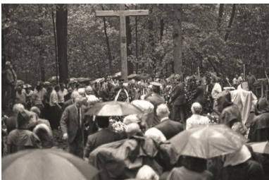
Msza św. 10 sierpnia 1991 r. wraz z pochówkiem polskich oficerów ekshumowanych w Charkowie-Piatichatkach.

„zrobiło się ciemno jak w nocy, ludzie nie wiedzieli, co się dzieje, konary fruwały. I pamiętam, jak ktoś nagle powiedział: »To tak jakby Pan Bóg zapłakał«”.