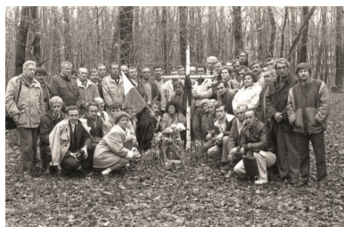
Uczestnicy wyprawy pracowników Energopolu 1 listopada 1990 r. przy dołach śmierci w Charkowie-Piatichatkach.

- jak zapamiętał pan Andrzej. Na końcu zrobiono zdjęcie pamiątkowe całej grupy. Szybko zaczęło się ściemniać, pobyt w lesie nie był więc długi. Andrzej Świdorski wspominał, że cała grupa z powrotem przeszła przez ogrodzenie, a wartownika już nie było. Polska baza Energopolu w Kotelwie była pod stałą kontrolą KGB z racji wykonywanych prac budowlanych na terenie Ukrainy należącej do ZSRS. Pracownicy Energopolu za udział w wyprawie nie spotkali się z represjami, tym bardziej że większość pracowała rotacyjnie - przyjeżdżali na kontrakt na dwanaście miesięcy i wracali do kraju.