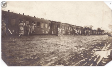
Żołnierze Błękitnej Armii przy i w pociągu zmierzającym do Polski, 1918 r.