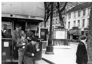
Wejście do metra na Champs Elysees w Paryżu, 1944 r.