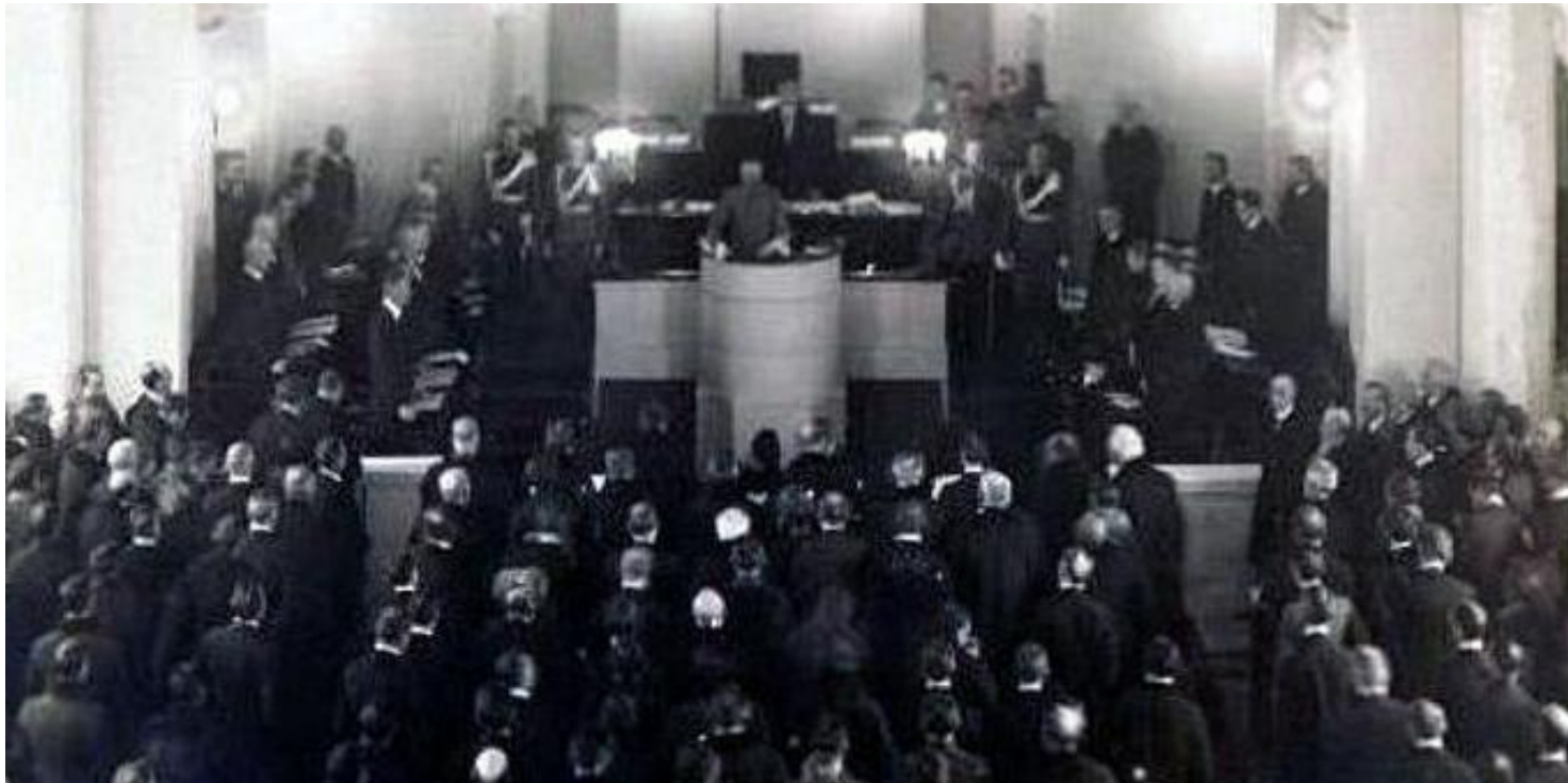
Sejm, 10 II 1919 r.

https://przystanekhistoria.pl/pa2/tematy/gabriel-narutowicz/87706,Zycie-polityczne-w-Polsce-pierwszych-lat-niepodleglosci.html