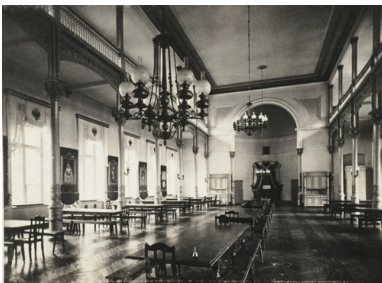
Na fotografii z 1902 r. wnętrze budynku Instytutu Aleksandryjsko-Maryjskiego, który był pierwszą siedzibą parlamentu w II RP.

Odpowiedzią na tę propozycję stał się wybuch, w nocy z 2 na 3 maja 1921 r., kolejnego, trzeciego już powstania. Zryw był najpotężniejszy z dotychczasowych – powstańcy szybko osiągnęli linię Odry. Polityczny błąd Korfanteo, który uznał, że powstanie osiągnęło swój cel i można wrócić do domów, sprawił, że o ziemię śląską trzeba było, w znacznie już trudniejszych warunkach militarnych, nadal krwawo się zмагаć. Powstańcy niejednokrotnie dawali przykłady odwagi, zaciętości i determinacji, wspomnieć należy choćby bitwę pod Górą św. Anny. Ostatecznie Rada Ligi Narodów, w kilka miesięcy po przerwaniu walk, podjęła kompromisową decyzję, na mocy której Polska otrzymała zaledwie 29% terytorium plebiscytowego z około 46% ludności, ale za to z bardzo cennymi z gospodarczego punktu widzenia obiektami przemysłowymi.