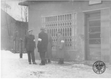
Ormowcy przed sklepem spożywczym Gminnej Spółdzielni Samopomoc Chłopska (GS) w Niwie w pow. olkuskim

Drugim etapem centralizacji rynku wewnętrznego była dekonstrukcja polskiego ruchu spółdzielczego. Pozornie niegroźne zmiany spowodowały stan, w którym spółdzielnie jedynie formalnie zachowały swój pierwotny charakter, faktycznie stając się firmami państwowymi. Handel hurtowy został w miastach zdominowany przez Centralę Spółdzielni Spożywców „Społem”, z kolei na wsi identyczną rolę zaczęła pełnić Centrala Rolniczych Spółdzielni „Samopomoc Chłopska”. Komuniści wytworzyli szereg branżowych centrali i przedsiębiorstw spółdzielczo-państwowych. Wszystkie powyższe instytucje nie miały już wiele wspólnego z samodzielną przedsiębiorczością, skierowaną na wspólne dobro zarówno wytwórców, jak i konsumentów.