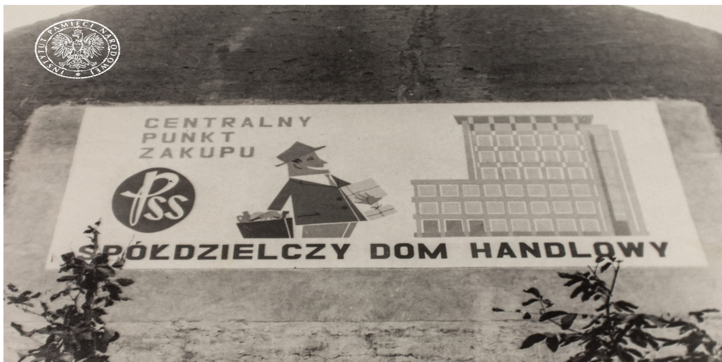
Reklama Spółdzielczego Domu Handlowego w Rzeszowie

https://przystanekhistoria.pl/pa2/tematy/gospodarka/100662,Bitwa-o-handel.html