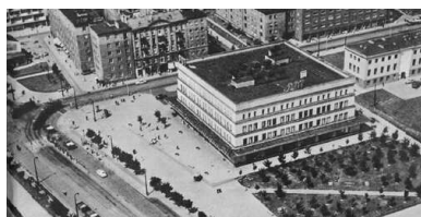
Powszechny Dom Towarowy Wola w Warszawie

Na obradującym w dniach 13-14 kwietnia 1947 r. plenum Komitetu Centralnego Polskiej Partii Robotniczej władze komunistyczne podjęły decyzję o drastycznym dostosowaniu handlu wewnętrznego w Polsce do standardów sowieckich. Obrane wówczas kierunki zmian, które przeszły do historii jako „bitwa o handel”, spowodowały na długie dziesięciolecia niekończące się trudności w zaopatrzeniu społeczeństwa w podstawowe produkty oraz wszechobecne kolejki.