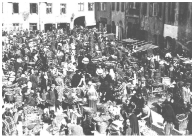
Sprzedaż owoców i warzyw na targowisku przy ul. Szeroki Dunaj w Warszawie, 1925 r.

Więc drukowanie pieniądza jest dla rządów, mogących o tym decydować, najłatwiejszą i najtańszą formą realizacji zobowiązań. Dzieje się tak w przypadku, gdy wpływy podatkowe nie pokrywają wydatków: a w roku 1923 dochody skarbu państwa polskiego z tytułu podatków (których nie waloryzowano) pokrywały niespełna 10% wydatków (w Niemczech był to zaledwie 1%).