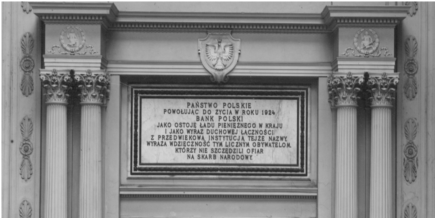
Bank Polski.

https://przystanekhistoria.pl/pa2/tematy/gospodarka/105373,Przed-stu-laty-Gdy-w-Polsce-byli-sami-milionerzy-Hiperinflacja-w-Polsce-1923-1924.html