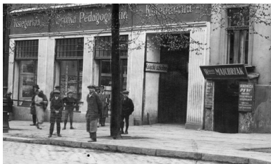
Fragment ulicy i witryny sklepów w Poznaniu, 1925 r.

Rząd odrodzonej Rzeczypospolitej miał do dyspozycji Polską Krajową Kasę Pożyczkową. Od 1917 roku