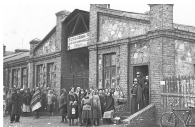
Rodziny strajkujących oczekują przed bramą kopalni węgla kamiennego "Klimontów" w Sosnowcu, 1933 r.

W okresie międzywojennym wśród mieszkańców pochodzenia niemieckiego stale zmniejszał się odsetek inteligencji, ponieważ osoby z cenzusem akademickim nie mogły liczyć na zatrudnienie w urzędach państwowych, a wolne zawody nie generowały odpowiednio pokaźnej liczby atrakcyjnych stanowisk. Korzystając z konwencji genewskiej, mniejszość niemiecka w województwie śląskim zakładała własne szkoły, kluby sportowe, instytucje kulturalne itp. Wydawała własną prasę, a do najbardziej poczytnych niemieckich periodyków należały „Der Oberschlesische Kurier” i „Kattowitzer Zeitung”. Mimo silnych tendencji integracyjnych, wynikających z potrzeby ochrony praw mniejszościowych, górnośląscy Niemcy byli politycznie podzieleni. Do najsilniejszych partii należały prawicowa, skupiająca katolików Katholische Volkspartei oraz Deutsche Partei, grupująca przeważnie ewangelików. Stosunki polsko-niemieckie od początku istnienia województwa śląskiego nie układały się pokojowo. Świeża pamięć o walkach w dobie powstań śląskich wzmagala antagonizm narodowy, łagodzony jednak świadomością wzajemności praw przysługujących mniejszościom po obu stronach granicy. Ponadto rządząca województwem w pierwszej połowie lat dwudziestych Chrześcijańska Demokracja nie była zainteresowana eskalacją konfliktu narodowego i hołdowała metodzie łagodnego przyciągania do polskości. Zaostrzenie polityki antyniemieckiej na tym terenie nastąpiło po przewrocie majowym i przejściu władzy przez wojewodę Grażyńskiego 9 .