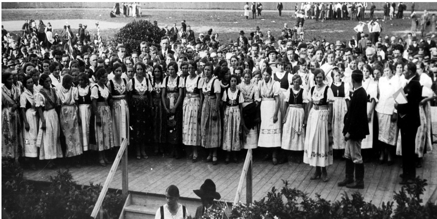
Dożynki śląskie w Katowicach, 16 września 1934 r.

https://przystanekhistoria.pl/pa2/tematy/gospodarka/70866,Pierwsze-lata-województwa-slaskiego-w-II-RP.html