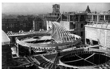
Budowa gmachu Sejmu Śląskiego i Urzędu Wojewódzkiego w Katowicach, wrzesień 1926 r.