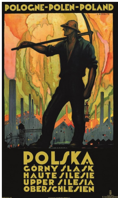
Plakat Stefana Norblina Górny