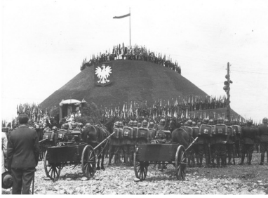
Obchody w Piekarach Śląskich 15 rocznicy powrotu Górnego Śląska do Polski. Ogólny widok Kopca Wyzwolenia podczas mszy polowej, 20 czerwca 1937 r.

Bujnie rozwijało się także życie kulturalne, budowane w oparciu o teatry w Katowicach, Bielsku i Cieszynie. Działały liczne organizacje społeczne, m.in. Liga Morska i Kolonialna, Liga Obrony Powietrznej i Przeciwigazowej, Towarzystwo Czytelni Ludowych oraz Śląskie Towarzystwo Przyjaciół Nauk na Śląsku. Imponująca lista instytucji, urzędów i organizacji, tu tylko zasygnalizowana, świadczy o tym, że województwo śląskie od początku swego istnienia aktywnie włączyło się w życie społeczne II Rzeczypospolitej, stając się jej ważną częścią. 13