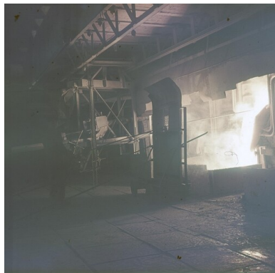
Huta Warszawa, 1980. Spust stopionego metalu z pieca. Widoczna tarcza ochronna przed piecem.

im urządzenia wykańczające takie jak strugarki, czyszczarko-polerki. Zapleczem działów produkcyjnych było centralne laboratorium, gdzie m.in. stale badano skład chemiczny wytopów.