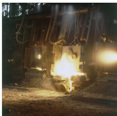
Huta Warszawa, 1980. Wytop metalu w piecu hutniczym.

Dążąc zatem do zwiększenia wpływów robotników w ważnej dla władz PRL sferze wielkiego przemysłu w ramach pionierskiego planu 6 letniego (1950-1955) obok m.in. wybudowania Fabryki Samochodów Osobowych na Żeraniu zdecydowano o powstaniu huty stali na warszawskich Młocinach. Stolicy brakowało wcześniejszych doświadczeń, a tym bardziej tradycji w tej branży przemysłowej. Nowy zakład produkcyjny w bazowej postaci zbudowano w latach 1954-1957, a więc w czasie postalinowskiej „odwilży” rzutującej tak na rzeczywistość społeczno-polityczną ówczesnej PRL, jak też na realia funkcjonowania zakładu.