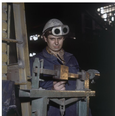
Huta Warszawa, 1980. Hutnik w kasku z goglami przy wadze z przesuwym ciężarkiem.

Wszak przynajmniej z nazwy robotnicy stanowili ważną składową Polskiej Zjednoczonej Partii Robotniczej – partii przez kolejne dekady niepodzielnie rządzącej w PRL. A właśnie nowe szeregi tzw. klasy robotniczej widziano jako przeciwwagę dla historycznie mocno zakorzenionych w stolicy środowisk inteligenckich, naukowych i kulturalnych.