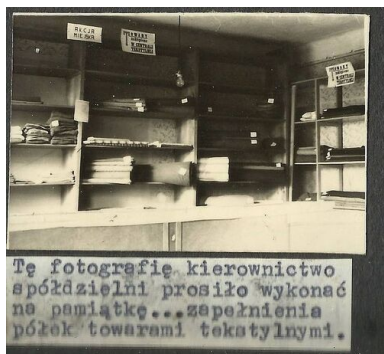
Wnętrze sklepu Spółdzielni „Oszczędność” w Skarżysku-Kamiennej, 1947 r.

Rozwój handlu na terenie województwa kieleckiego utrudniał dodatkowo brak hurtowni. Kupcy z Kielc, Częstochowy i innych ośrodków zmuszeni byli do wyjazdów do Radomia, Krakowa, Łodzi lub na Śląsk w celu zaopatrzenia się w poszukiwane towary. Przy stanie ówczesnej infrastruktury transportowej przysparzało to wiele trudności. Mimo to pierwsza połowa 1945 r. była dla handlu okresem bujnego rozkwitu. Szybko wzrastała liczba przedsiębiorstw, szczególnie zajmujących się sprzedażą artykułów spożywczych, co było zjawiskiem typowym w okresie powojennym. Pociągało to za sobą również zjawiska niepożądane, jak np. prowadzenie sprzedaży artykułów niezgodnych z wykupioną kartą rejestracyjną (stąd na witrynie jednego sklepu obok słoniny i wędlin można było znaleźć buty i wyroby galanteryjne) oraz rozwój nielegalnego handlu, nierzadko towarami pochodzącymi z szabru.