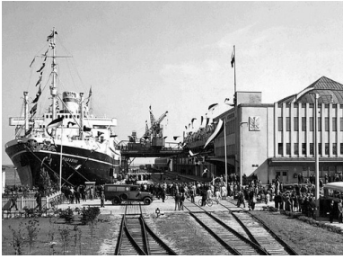
Transatlantycki dworzec morski; przy nabrzeżu m/s „Piłsudski”, przed 1938 r.