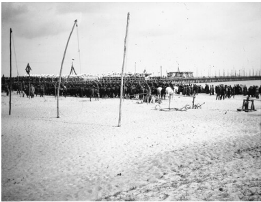
Otwarcie Tymczasowego Portu Wojennego, 27 kwietnia 1923 r.