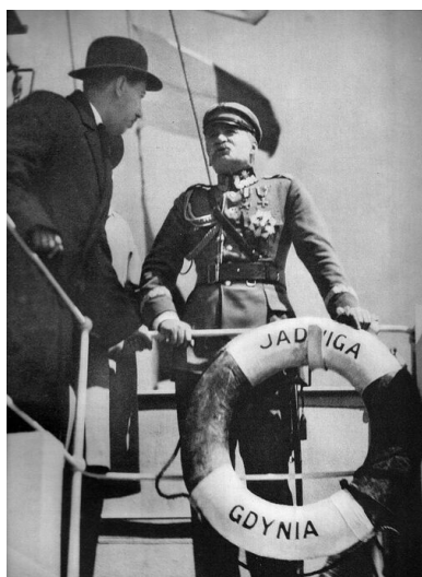
Marsz. Józef Piłsudski i Eugeniusz Kwiatkowski oglądają port w Gdyni z pokładu statku

W okresie międzywojennym z dyskursu na poziomie idei narodziła się swego rodzaju synteza w sferze polityki realnej: Kresy, tak ważne dla kształtowania się polskiej tożsamości kulturowej i duchowej, okrojone wprawdzie pokojem ryskim z 1921 r., pozostały w znacznej swej części w granicach II Rzeczypospolitej, współtworząc nadal tę tożsamość, dostęp do morza zaś nie tylko szeroko otworzył przed gospodarką wrota na wodne szlaki, lecz również stał się zaczątkiem nowej, powszechnej świadomości „morskiej”. Postulaty narodowców urzeczywistnili ich oponenti – piłsudczycy.