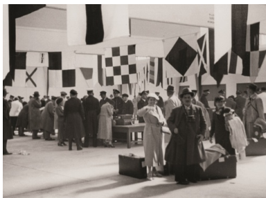
Sala odprawy celnej na Dworcu Morskim w Gdyni.

„W Dalmacji pytali mnie dziennikarze: «Jak wy to robicie, skoro my, już od pół wieku niepodlegli [...] mamy zaledwie kilka stateczków» – opowiadał swoim czytelnikom Wańkowicz – skoro Portugalczycy wyrażali mi zdumienie, że będąc trzecim imperium kolonialnym świata, przed wojną nie mieli żadnej linii własnej, a obecnie mają żałosne początki, skoro... ech, co tu gadać, skoro w Gravesund [właśc. Gravesend] polski marynarz skłął [...] angielskiego marynarza i wygodził mu nieprawdopodobnym wolapükem [wolapikiem] od oferatów i niedojdów, bo źle podjechał do schodni – to już teraz wiem, że [...] wzbogacimy leksykon przekleństw tak, że się nieboszczyk [Samuel] Linde w grobie przewróci.” 12