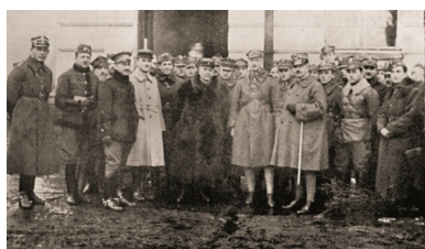
Komisja Ligi Narodów w koszarach wileńskich. 1919 r.

Litwini nie rezygnowali z północnej części powiatu suwalskiego, gdzie m.in. w Wiżajnach i Andrzejewie przystąpili do likwidacji polskich instytucji. Stan okupacji litewskiej budził zaniepokojenie wśród mieszkających tam Polaków, zwłaszcza że Litwini zamierzali przejąć całą administrację wojskową i cywilną. Z nastrojów ludności doskonale zdawało sobie sprawę kierownictwo Suwalskiego Okręgu Polskiej Organizacji Wojskowej (POW), które postanowiło wykorzystać je w antylitewskiej akcji zbrojnej. 16 sierpnia zapadła decyzja o wybuchu powstania sejneńskiego, którego celem było odzyskanie Sejnu i obszaru do wyznaczonej linii Focha. Jako termin jego rozpoczęcia wybrano noc z 22 na 23 sierpnia. W wyniku działań powstańczych, prowadzonych w dniach 23–28 sierpnia przez oddziały POW wsparte przez II batalion 41. Suwalskiego Pułku Piechoty, wojska litewskie zostały wyparte z rejonu Sejnu. Do 9 września oddziały polskie wyparły Litwinów za linię Focha.