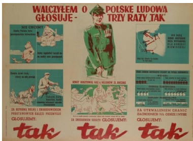
Przedreferendalna ulotka propagandowa