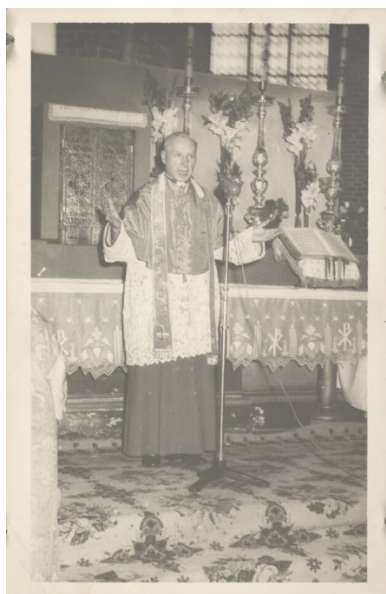
Kardynał Stefan Wyszyński podczas ponownego poświęcenia katedry św. Jakuba i św. Agnieszki w Nysie, 15 sierpnia 1959 r.