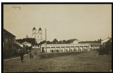
Polska, Sejny, 1918. Pocztaówka

Było to jednak szczególnie trudne w regionach, gdzie Polacy nie stanowili przytłaczającej większości, a zamieszkane przez nich tereny znalazły się w obszarze zainteresowania sąsiednich państw. Taka sytuacja miała miejsce na Suwalszczyźnie, zamieszkałej na początku XX w. głównie przez Polaków i Litwinów.