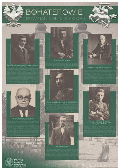
..., „Bohaterowie Powstania Sejneńskiego” i...