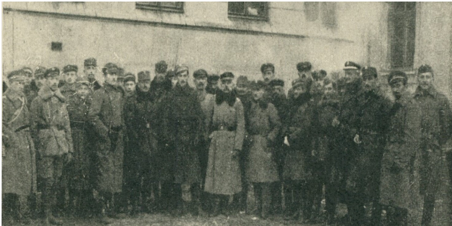
Grupa oficerów załogi szkoły Sienkiewicza. Ze zbiorów BN

https://przystanekhistoria.pl/pa2/tematy/granice/88765,Plutonowy-Roman-Feldstein-jeden-z-obroncow-Lwowa.html