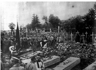
Pogrzeb polskich obrońców Lwowa poległych w obronie tego miasta przed Ukraińcami, listopad 1918 r.