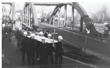
Gdyńska Droga Krzyżowa, 1995 r.

Komuniści się przerazili. Stworzyli klasę robotniczą, ale miała to być zindoktrynowana, bezwolna masa, stanowiąca ich bazę polityczną. Tymczasem klasa ta nie tylko poczuła swoją siłę, nie tylko odwróciła się od partii noszącej miano „robotniczej”, lecz właśnie w niej odkryła swojego wroga. Robotnicy wielkich zakładów pracy zwrócili się przeciwko działaczom PZPR, zaczęła się walić z takim trudem zbudowana struktura.