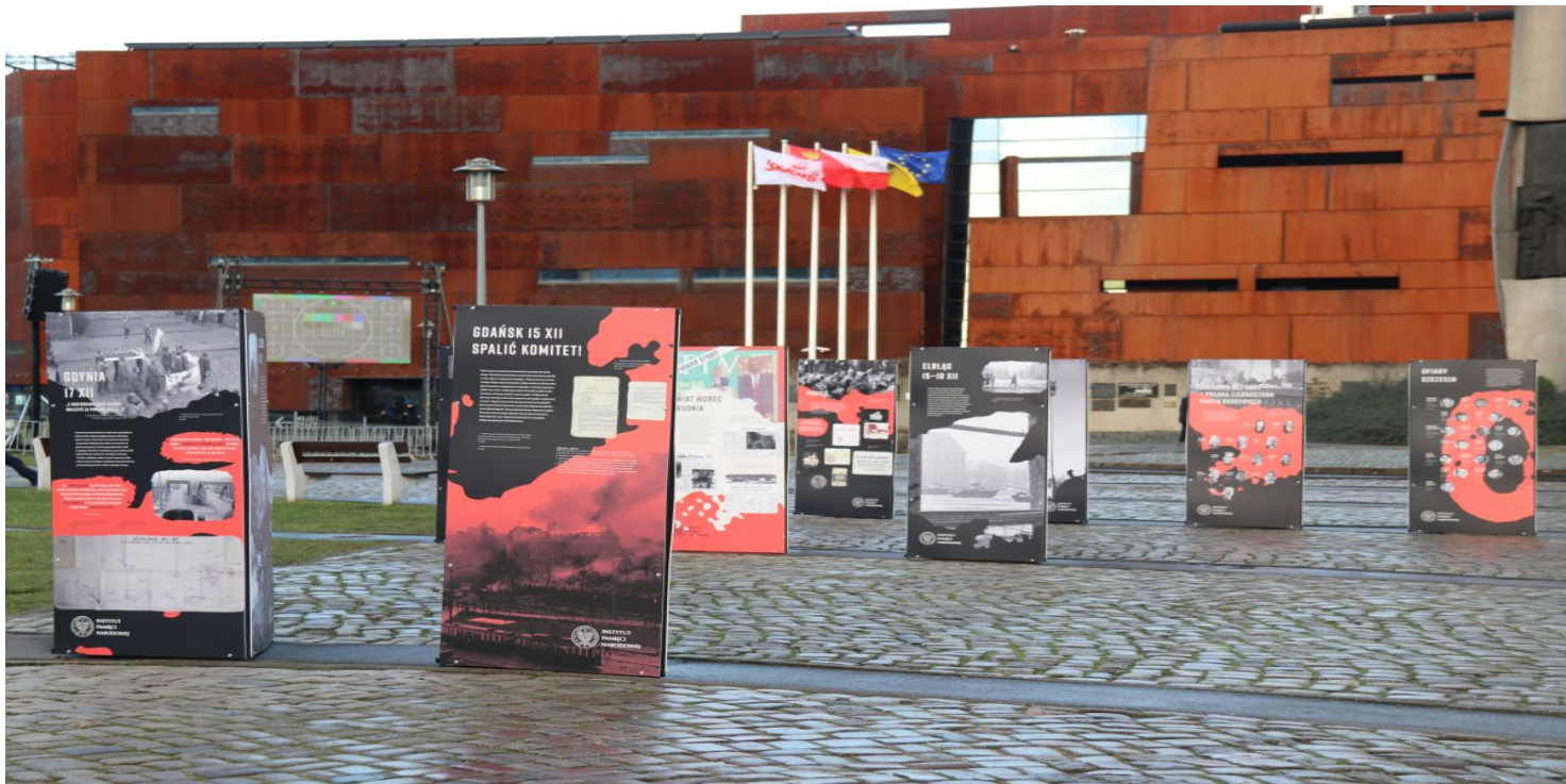
Wystawa IPN "Powstanie Grudniowe 1970 roku" na placu Solidarności w Gdańsku, 2020 r.

https://przystanekhistoria.pl/pa2/tematy/grudzien-1970/77627,Grudzien-03970-w-malym-miescie.html