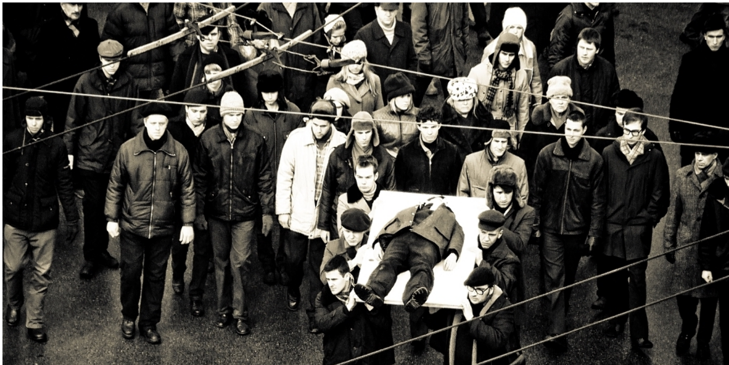
Grudzień 1970 w Gdyni

https://przystanekhistoria.pl/pa2/tematy/grudzien-1970/77816,Grudzien-w-naszej-pamieci-Recenzja-ksiazki-quotZbrodnia-bez-kary-Grudzien-1970-w.html