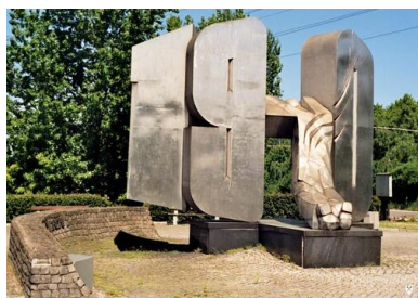
Pomnik Ofiar Grudnia 1970 w Gdyni przy ul. Janka Wiśniewskiego

Nie można w tym miejscu nie wspomnieć o świetnie dobranym materiale ilustracyjnym. Pozyskano go z dziesięciu archiwów oraz ze zbiorów prywatnych. Dla wielu osób zaznajomionych z tematyką dużą wartość stanowią będą rzadkie fotografie, archiwalia, jak i fragmenty artykułów prasowych publikowanych także po transformacji ustrojowej. Znalazło się również miejsce dla kilku dokumentów z wielotomowej dokumentacji procesowej dopiero niedawno przekazanej do archiwum Instytutu Pamięci Narodowej i zawierającej m.in. protokoły przesłuchań świadków.