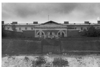
Warszawa, Cytadela. Widok