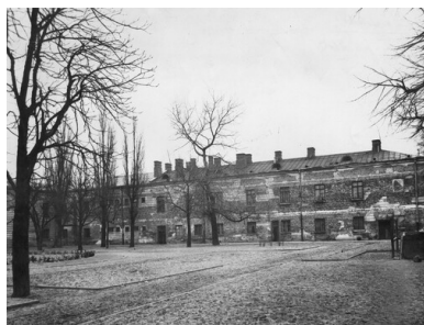
Warszawa, Cytadela, X Pawilon. Widok zewnętrzny. Zdjęcie z okresu Drugiej Rzeczypospolitej. Ze zbiorów Narodowego Archiwum Cyfrowego

lekarskiego. Pod koniec 1909 r. otrzymał propozycję pracy w szpitalu psychiatrycznym w Kulparkach nieopodal Lwowa. Został zatrudniony na stanowisku lekarza psychiatry. Przebywał tam do 1912 r., kiedy w nieznanych okolicznościach uzyskał możliwość powrotu na teren Cesarstwa Rosyjskiego.