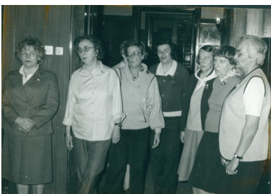
Zlot członkiń „Wędrownych