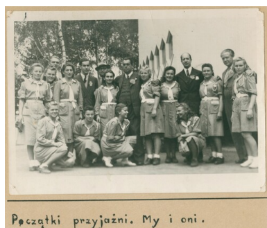
Karta z kroniki „Wędrownych Ptaków”