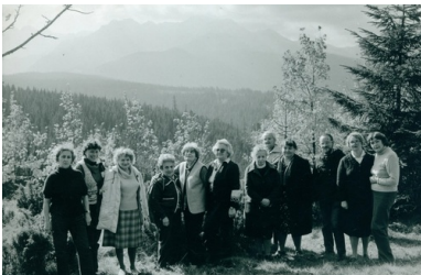
Zlot członkiń „Wędrownych Ptaków”, Głodówka 1984.