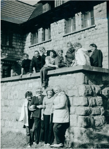
Zlot członkiń „Wędrownych Ptaków”, Głodówka 1984.