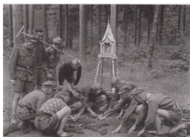
Budowa kapliczki na obozie letnim, Karpacz 1946 r.