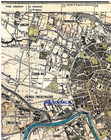
Miejsce akcji „Koppe”