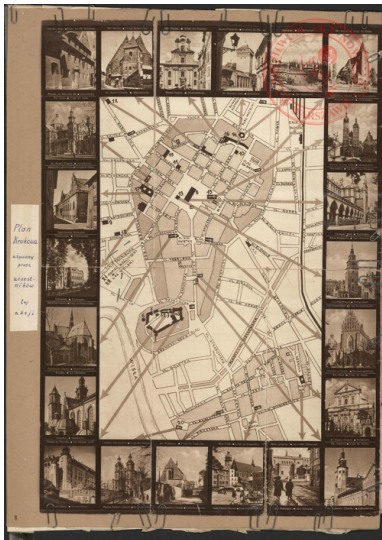
Dokumenty planistyczne „Parasola” zgromadzone przed Akcją Koppe: plan Krakowa.