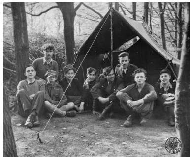
Grupa harcerzy ZHP przed namiotem, 1947.

1946 r. skierowano do pracy w ZHP hm. Pelagię Lewińską, już przed wojną związaną z ruchem komunistycznym. Podjęła się ona zadania opanowania i przebudowy ideologicznej harcerstwa. Do pracy zaangażowano także Główny Zarząd Polityczno-Wychowawczy Wojska Polskiego, który akcją letnią ZHP w 1947 r. objął „opieką polityczną”.