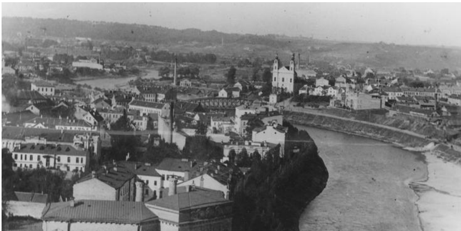
Panorama Wilna

https://przystanekhistoria.pl/pa2/tematy/harcerstwo/92047,Harcerskie-wychowanie.html