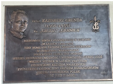
Tablica ppor. Kazimierza Grendy na budynku Zespołu Szkół im. Kryptologów Poznańskich w Luboniu, 2022 r.