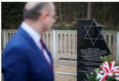
Pomnik upamiętniający 375 Żydów na Cmentarzu Ofiar Hitleryzmu 1939-1945 - Jagiełła, 24 marca 2023.