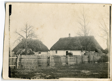
Markowa w obiektywie Józefa Ulmy

MS: To jest zastanawiające, bo przecież przed wojną ta wieś raczej nie wyróżniała się od innych, sąsiednich, relacjami polsko-żydowskimi. I tu przecież też były od 1942 r. łapanki Żydów, które polscy mieszkańcy musieli przeprowadzać na rozkaz niemiecki. Markowa to jednak wieś największa, bardzo spójna (tylko nieliczni jej mieszkańcy nie mieli tu przodków sięgających XIV w.), a znaczna grupa gospodarzy była całkiem majątna i dysponowała rezerwami żywnościowymi. W Markowej ukrywali się Żydzi sąsiedzi oraz spoza miejscowości. Ale ci ostatni albo byli spokrewnieni z markowskimi, albo pochodzili z niedalekiej okolicy i byli dobrze znani polskim mieszkańcom wioski.