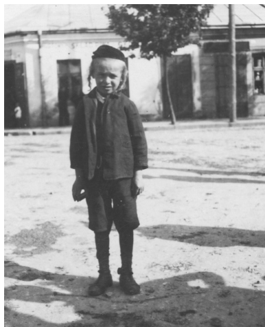
Dziecko żydowskie z Rudnika nad Sanem na zdjęciu z okresu międzywojennego.

podpowiedział mu, aby szedł dalej, do miejscowości Nowe Piekuty. W ten sposób Fajwiszys trafił do młodego księdza – Stanisława Falkowskiego.