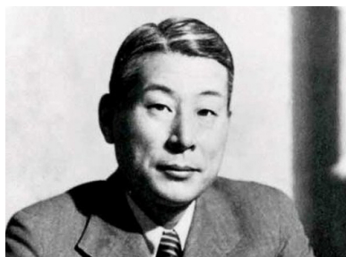
Chiune Sugihara (1900-1986)

W 1985 r. przyznano mu odznaczenie Yad Vashem.