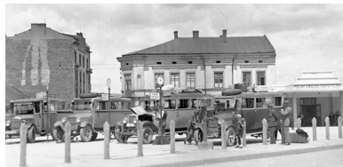
Plac Zgody (obecnie Plac Bohaterów Getta) w 1931 r.

którzy nie otrzymali pieczętek „na życie”, jak je później określano w relacjach. Do transportów w pierwszej kolejności skierowano głównie starszych, chorych, a także kobiety ciężarne i z dziećmi. Nierzadko deportowano kilka osób z jednej rodziny.