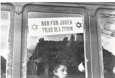
Tramwaj w getcie warszawskim, październik 1940 r.

Wydawało się pisarce, że milczącą obojętność zachowują wobec niesłychanej zbrodni także Polacy, zarówno przedwojenni „polityczni przyjaciele Żydów”, jak i ich przeciwnicy.