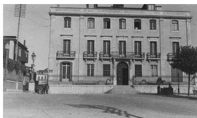
Widok zewnętrzny gmachu Poselstwa RP w Lizbonie.

Od końca 1940 r. do listopada 1941 r. Komitet wysłał ponad 26 tys. paczek. Każda ważyła pół kilo i zawierała herbatę, kawę lub kakao. Oczywiście była to kropla w morzu potrzeb, z czego wszyscy zdawali sobie sprawę, niemniej wówczas liczone, że inicjatywa ta rozwinie się. Wkrótce Komitet zdobył dofinansowanie Ministerstwa Pracy i Opieki Społecznej, a sprawą paczek interesował się osobiście Ludwik Grosfeld (1889-1955), jeden z dyrektorów departamentu MPIOS. Na jesieni 1941 r. przysłał na ten cel do Lizbony sumę ponad 6500 dolarów. Akcję ponadto zdecydował się poprzeć także Związek Żydów Polskich w Argentynie (Ispol - Union Israelita Polaca en la Argentina ). Prawdopodobnie od tego czasu, tj od jesieni 1940 r. paczki, początkowo w niewielkiej ilości, zaczęły trafiać także do getta.