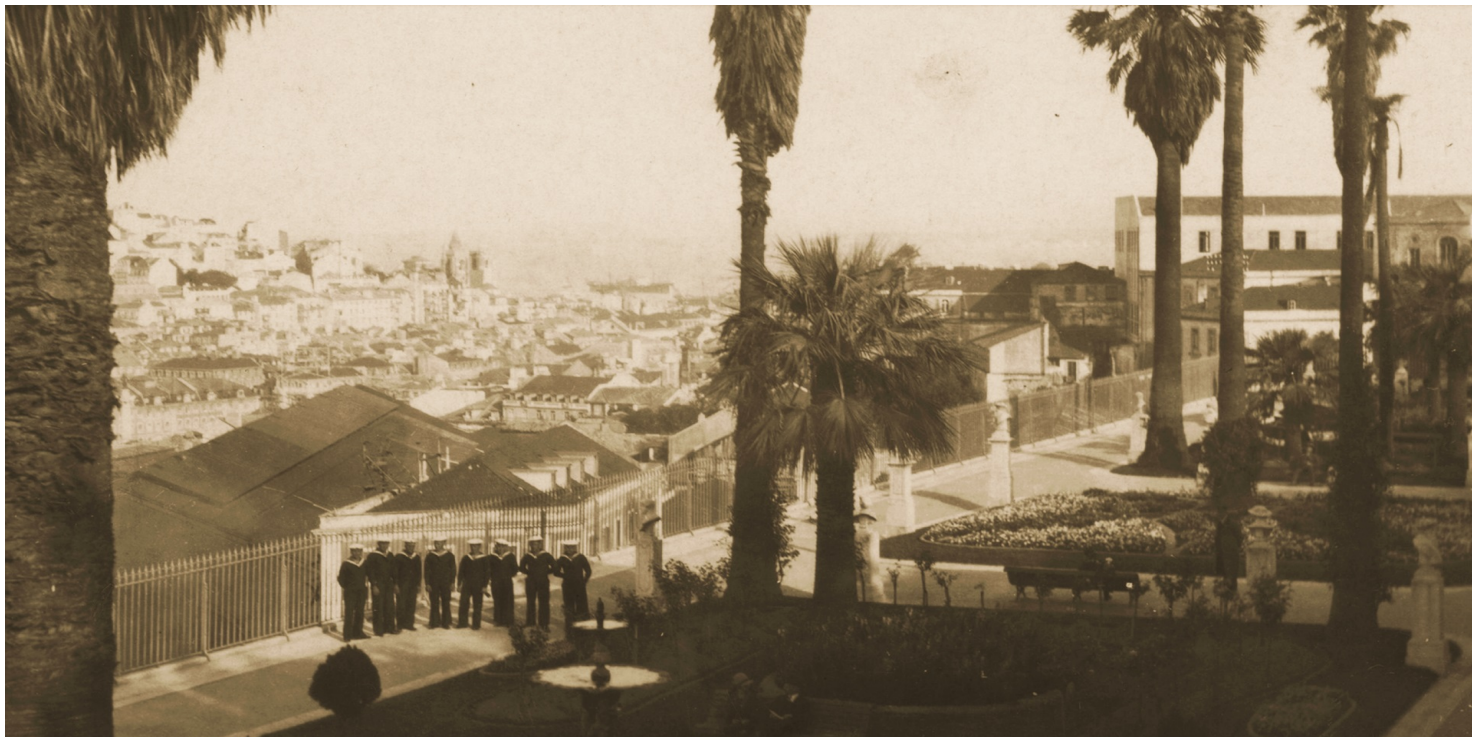
Panorama Lizbony.

https://przystanekhistoria.pl/pa2/tematy/holocaust/78310,Akcja-paczkowa-Polskiego-Komiteu-Pomocy-Uchodzcom-w-Portugalii-na-rzecz-Zydow-w.html