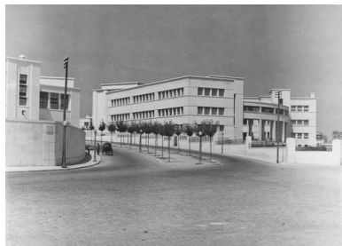
Nowoczesne osiedle w stolicy Portugalii, 1941 r.

kontrolę nad doręczeniem przesyłek w okupowanej Polsce. Zagłada była w toku, więc zastanawiano się, czy pomoc paczkowa miała w ogóle sens.