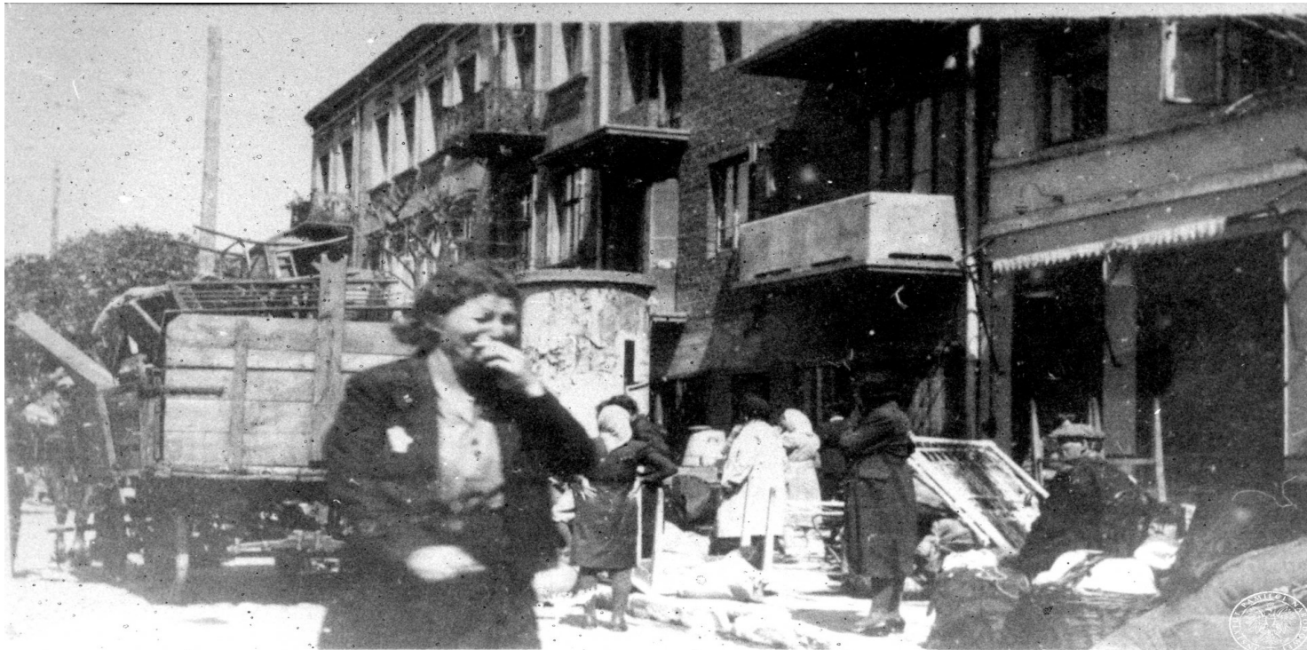
Wysiedlanie kutnowskich Żydów do getta, 16 czerwca 1940 r.

https://przystanekhistoria.pl/pa2/tematy/holocaust/94300,Kto-nie-potepia-ten-przyzwala-Protest-Zofii-Kossak-Szczuckiej.html