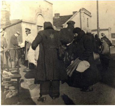
Żydzi we Włocławku noszący żółte odznaki na plecach

do 60 proc. Według Jana Szilinga z Pomorza Gdańskiego, które weszło w skład Okręgu Rzeszy Gdańsk-Prusy Zachodnie, ewakuowało się nawet ponad 50 proc. Żydów.