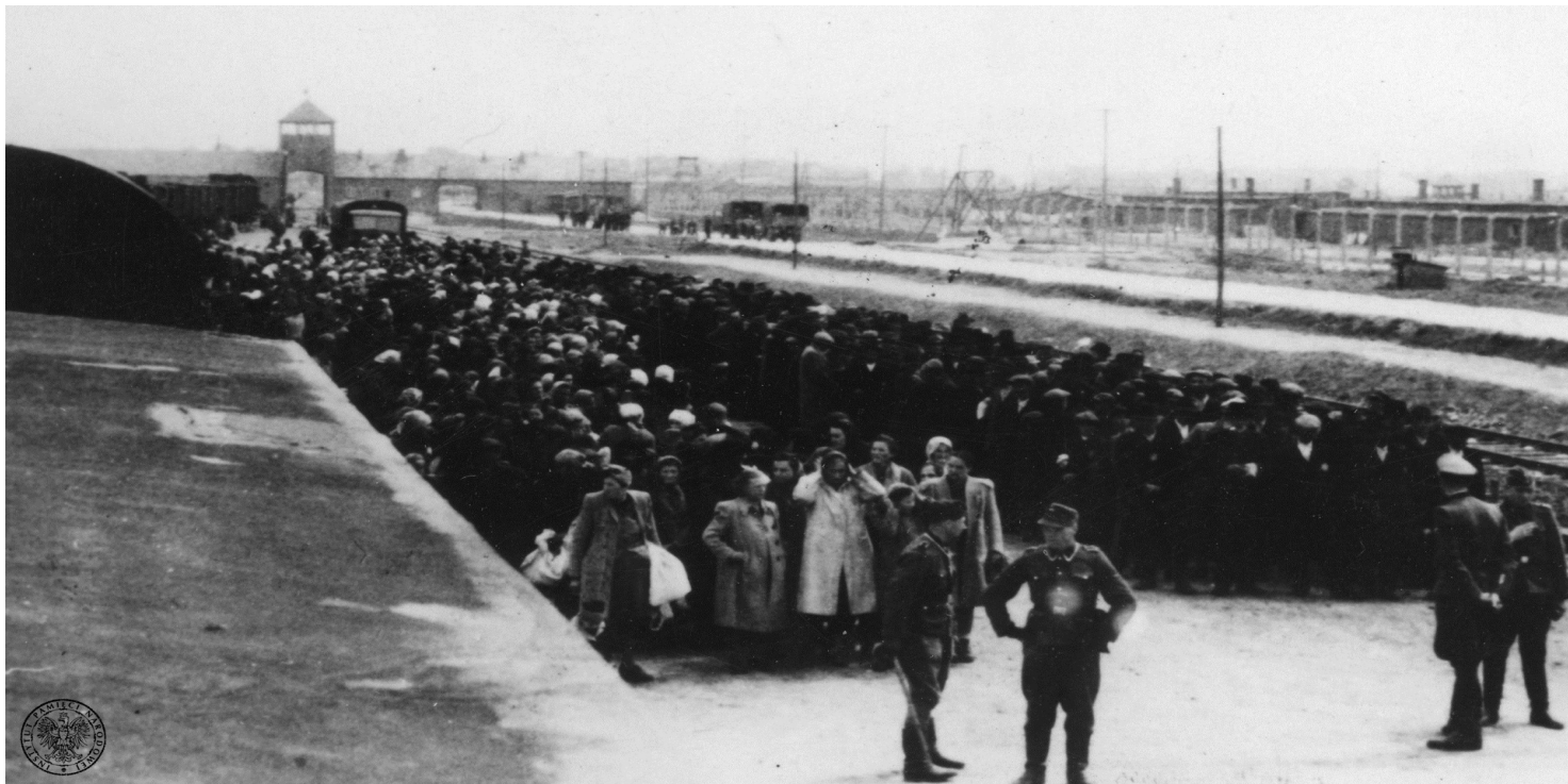
Selekcja transportu więźniów na rampie boczniczy kolejowej w obozie zagłady KL Auschwitz-Birkenau, maj 1944 r.

https://przystanekhistoria.pl/pa2/tematy/holocaust/95878,Auschwitz-a-front-wschodni.html