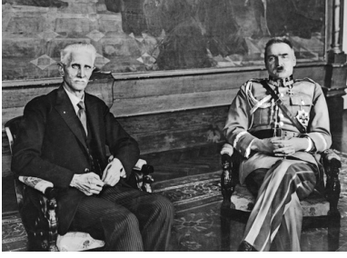
Marszałek sejmu Ignacy Daszyński i marszałek Józef Piłsudski, 1928 r.