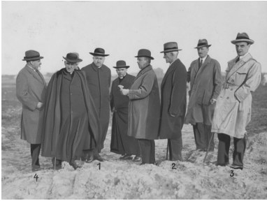
Członkowie Komitetu Budowy Kościoła Opatrzności Bożej w Warszawie. Abp Adam Sapieha (drugi z lewej), kard. August Hlond (trzeci z lewej), Ignacy Daszyński (trzeci z prawej), 1928 r.