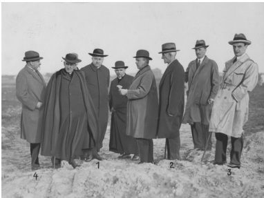
Członkowie Komitetu Budowy Kościoła Opatrzności Bożej w Warszawie. Abp Adam Sapieha (drugi z lewej), kard. August Hlond (trzeci z lewej), Ignacy Daszyński (trzeci z prawej), 1928 r.

Daszyński, jeden z najważniejszych liderów polskiego socjalizmu, daleki był od ideologicznego dogmatyzmu. Mimo wyrazistych poglądów był człowiekiem kompromisu, absolutnie wyzbytym ambicji sprawowania władzy. Jako przywódca Polskiej Partii Socjalno-Demokratycznej Galicji i Śląska Cieszyńskiego zasiadał w austriackiej Radzie Państwa. Walczył o socjalizm, ale daleki był od metod rewolucyjnych. Idea nie przesłaniała mu realnych problemów robotników.