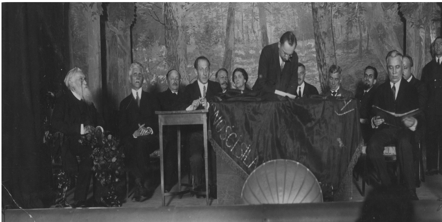
IV Zjazd Towarzystwa Uniwersytetu Robotniczego w 1924 r. Drugi z lewej Ignacy Daszyński.

https://przystanekhistoria.pl/pa2/tematy/ignacy-daszynski/87214,ignacy-daszynski-polityk-niezalezny.html