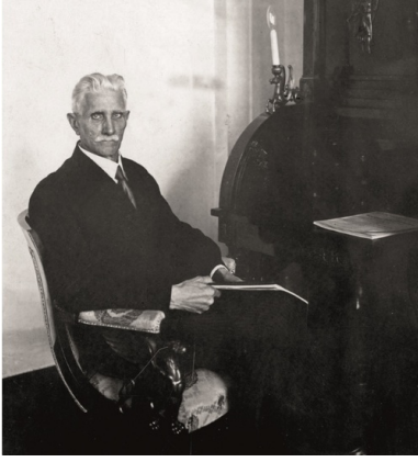
Ignacy Daszyński w swym sejmowym gabinecie, wyposażonym w efektowne, podkreślające rangę gospodarza meble, 1928 r.