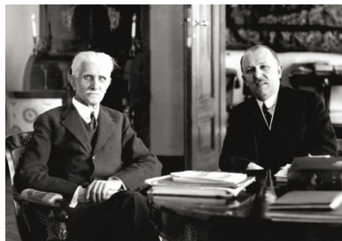
Ignacy Daszyński z prof. Kazimierzem Bartlem, kierującym rządem po raz czwarty (od 27 czerwca 1928 do 13 czerwca 1929 r.), czerwiec 1928 r.

W burzliwym okresie związanym z tzw. wyborami brzeskimi, kiedy aresztowano posłów opozycji, Daszyński apelował o ich uwolnienie. Pogarszający się stan zdrowia uniemożliwiał mu podejmowanie większej aktywności politycznej.