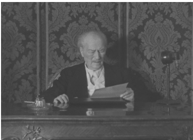
Ignacy Jan Paderewski przed mikrofonem radiowym w Chicago podczas tournée po Stanach Zjednoczonych, marzec 1923 r.

Zgodzić się należy z opinią wielu osób, w tym kard. Kakowskiego, że Paderewski nie był ani politykiem, ani dyplomatą – był bowiem zbyt uczciwy i prostolinijny: „Był i będzie po wsze czasy wielkim Polakiem, mistrzem tonów i gorącym patriotą polskim”. Nie żałował ciężko zarobionych pieniędzy na cele społeczne, dobroczynne i charytatywne. Tworzył fundacje, edukował na swój koszt młodzież artystyczną, otwierał swój dom na przybyszów i potrzebujących, bezinteresownie udzielał wsparcia licznym osobom. Był współwłaścicielem warszawskiego hotelu Bristol.