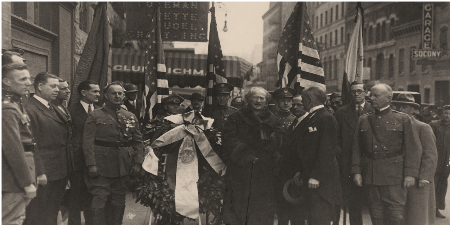
Ignacy Jan Paderewski po koncercie w Waszyngtonie, 1926 r.

https://przystanekhistoria.pl/pa2/tematy/ignacy-jan-paderewski/97119,Mistrz-Ignacy-Jan-Paderewski-18601941.html