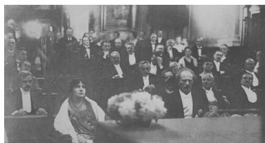
Ignacy Jan Paderewski wraz z żoną Heleną w czasie obrad Rady Miasta Poznania, 22 listopada 1924 r.