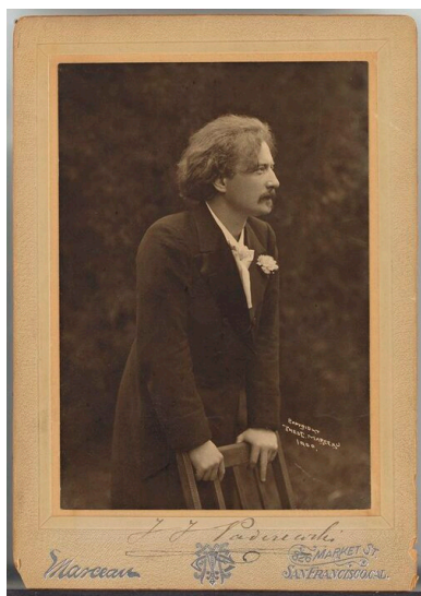
Ignacy Jan Paderewski, początek

Od 1917 roku był już oficjalnym przedstawicielem Komitetu Narodowego Polskiego w USA, dysponując przy tym bezpośrednim dostępem do najważniejszych amerykańskich polityków z prezydentem Thomasem Woodrow Wilsonem na czele.