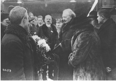
Przyjazd Ignacego Jana Paderewskiego do Poznania, 27 grudnia 1918 r.