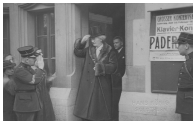
Ignacy Jan Paderewski podczas pobytu w Szwajcarii, opuszcza salę koncertową po swym koncercie w Solurze, 1937 r.

W istocie, krótko po zakończeniu nauki u Leszetyckiego, Paderewski rozpoczął błyskotliwą karierę pianisty-wirtuozą, szturmem zdobywając największe i najznamienitsze sale koncertowe świata.