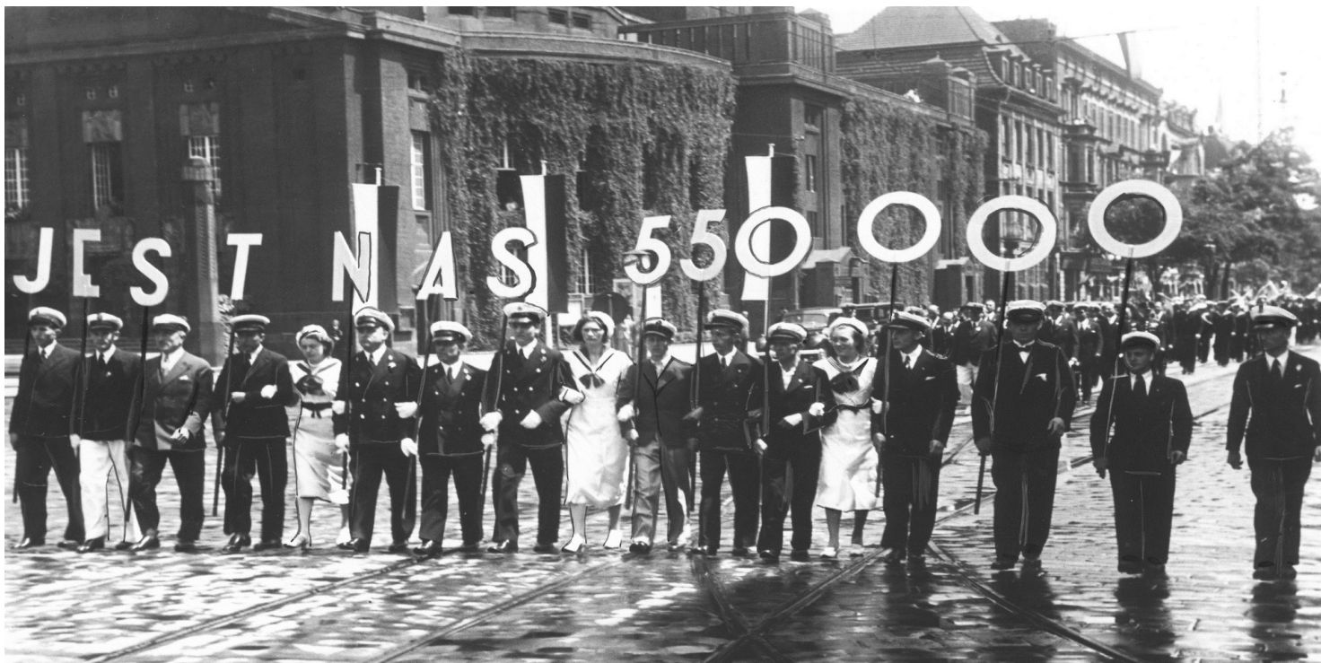
Członkowie Ligi Morskiej i Kolonialnej podczas defilady z okazji Święta Morza w Katowicach, 1937 r.

https://przystanekhistoria.pl/pa2/tematy/ignacy-moscicki/78710,Swieto-Morza-to-Swieto-calej-Polski.html