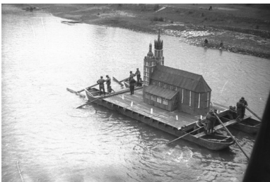
Łódzie z makietą kościoła Mariackiego podczas święta na Wiśle w Krakowie, 1934 r.

Wszystkiemu przygrywała orkiestra, a defiladzie przyglądała się stutysięczna publiczność, dla której zorganizowano także wiele innych atrakcji (oraz przygotowano pola namiotowe).