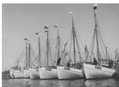
Kutry w czasie Dni Morza. Port morski w Gdyni, 1936 r.

31 lipca 1932 r. w Gdyni odbyło się pierwsze Święto Morza. Miało ono niezwykle patriotyczny charakter, jego obchody przyciągnęły wiele ważnych osobistości, m.in. prezydenta RP Ignacego Mościckiego, marszałka Sejmu Kazimierza Świtalskiego, marszałka Senatu Władysława Raczkiewicza, i premiera Aleksandra Prystora.