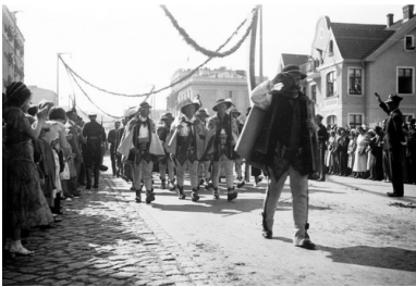
Górale z Zakopanego podczas defilady z okazji Święta Morza w Gdyni, 31 lipca 1932 r.

Miasto i port zostały udekorowane flagami. Po uroczystej mszy prezydent Ignacy Mościcki w przemówieniu powiedział, że „Święto Morza to Święto całej Polski”, czym dumnie podkreślił jak ważny dla naszego kraju jest dostęp do morza, przynoszący przy tym ogromne korzyści gospodarcze. Odbyła się imponująca defilada, w której uczestniczył batalion Marynarki Wojennej z Wejherowa, oddziały piechoty i kawalerii WP, członkowie licznych organizacji, związków i stowarzyszeń, uczniowie. Odbyła się również parada morską, podczas której można było podziwiać wiele jednostek, m.in. kutry rybackie i motorówki, okręty podwodne oraz kontrtorpedowce „Wicher”.