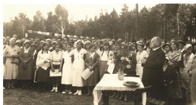
Dzień Pieśni Polskiej w Zakrzewie, 1935 r.