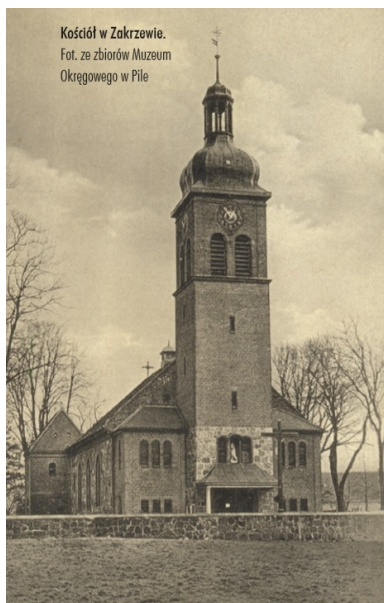
Kościół w Zakrzewie.