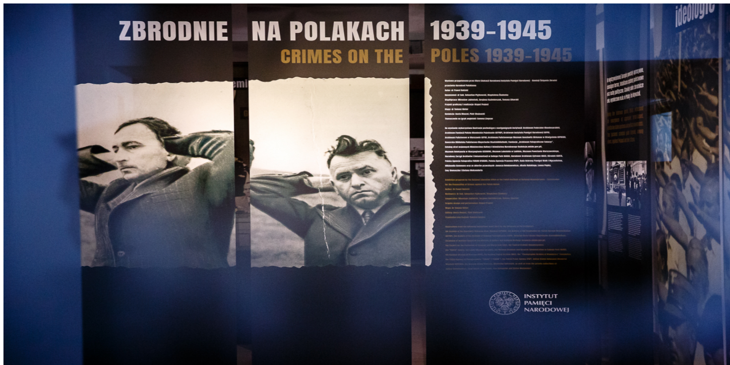
Wystawa IPN „Zbrodnie na Polakach 1939-1945” – Warszawa, 2019 r.

https://przystanekhistoria.pl/pa2/tematy/intelligenzaktion/90926,Aresztowania-i-deportacje-do-obozow-koncentracyjnych-inteligencji-polskiej-z-zie.html