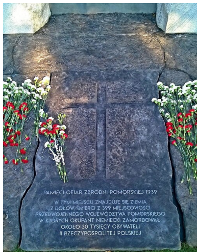
Tablica pamiątkowa z Pomnika Ofiar Zbrodni Pomorskiej 1939 r.

poniosła najliczniejsze straty – nauczycieli. Lista jest niepełna i należy przyjąć, że najprawdopodobniej w Grudziądzu zginęło ponad 300 osób. Nie byli to wyłącznie mieszkańcy miasta.