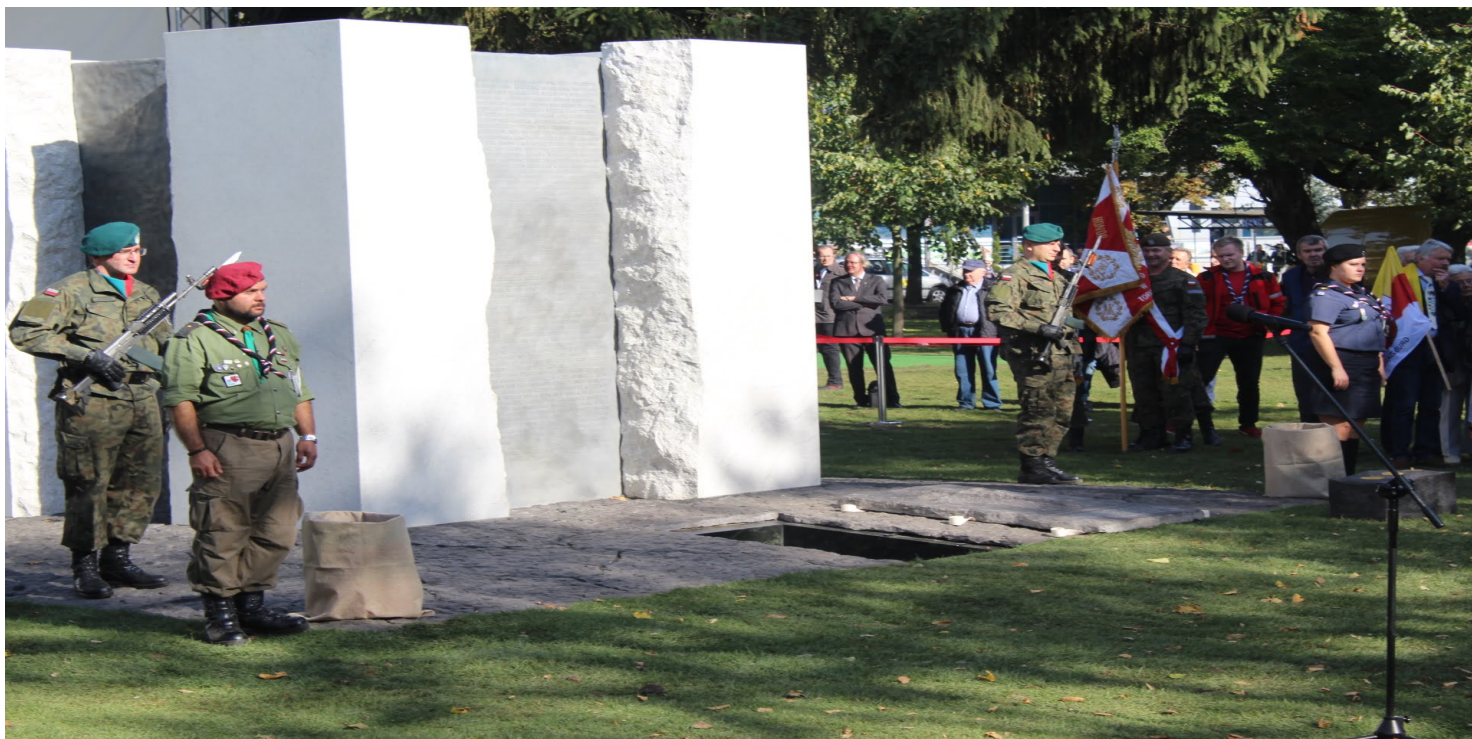
Uroczyste odsłonięcie Pomnika Ofiar Zbrodni Pomorskiej 1939 - Toruń, 6 X 2018 r.

https://przystanekhistoria.pl/pa2/tematy/intelligenzaktion/94802,Ksieze-Gory.html