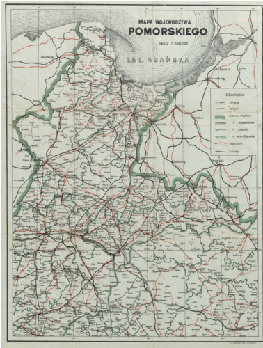
Mapa przedwojennego województwa pomorskiego