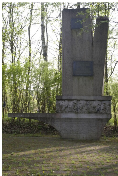
Pomnik ofiar egzekucji na