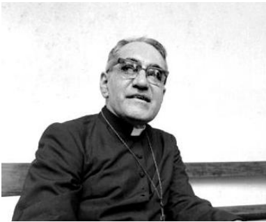
Arcybiskup Oscar Romero

To była z punktu widzenia peerelowskich władz czy szerzej krajów tzw. demokracji ludowej informacja pozytywna.