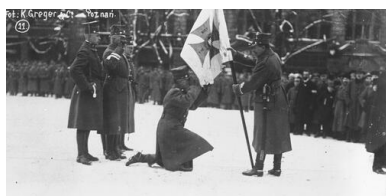
Uroczystość zaprzysiężenia wojsk powstańczych i wręczenie