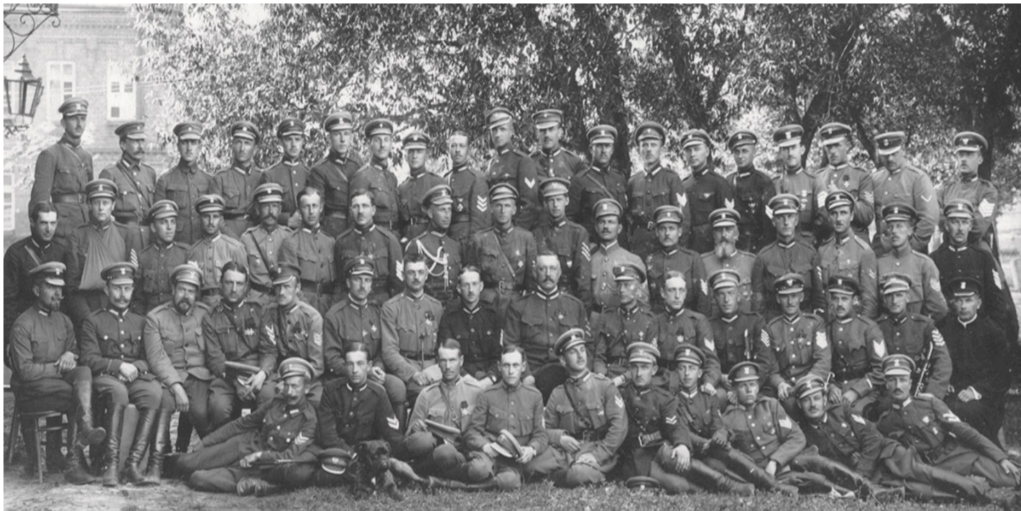
Oficerowie kawalerii I Korpusu Polskiego, wiosna 1918 r.

https://przystanekhistoria.pl/pa2/tematy/jozef-dowbor-musnicki/58029,Dowboria-kresowa-epopeja-I-Korpusu-Polskiego.html