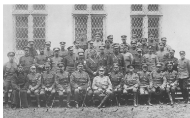
Dowódcy oddziałów I Korpusu Polskiego. Dowódcy oddziałów I Korpusu Polskiego z generałem Józefem Dowborem-Muśnickim (siedzi 6. z lewej), 1917 r.

W Bobrujsku, który awansował do rangi najważniejszego polskiego ośrodka na Kresach, wychodziła polska prasa, na urzędach powiewały flagi biało-czerwone, a poczta emitowała znaczki z orłem w koronie. Miasto, jak wspominali świadkowie, z zapyziałego garnizonu zmieniło się w miejscowość czystą i tętniącą życiem, w której działały organizacje społeczne i młodzieżowe (harcerstwo, Sokół, stowarzyszenia katolickie), teatr i gimnazjum. Rozkwitło życie towarzyskie, otwierano kawiarnie i restauracje. Funkcjonowały trzy świątynie: kościół katolicki, cerkiew i synagoga. Na ulicach dominował język polski, mimo że większość mieszkańców stanowili Żydzi. Im obecność Polaków nie tylko dawała możliwość prowadzenia handlu, lecz także zapewniała bezpieczeństwo przed krwawymi pogromami, które były codziennością wojny domowej w Rosji. Odetchnęli okoliczni ziemianie, którzy w czasach rewolucji niejednokrotnie przeżywali napady i pogromy swoich dworów i majątków. Teraz mogli wrócić do spustoszonych domów i podnosić je z ruin.