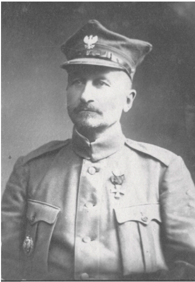
Gen. Józef Dowbor-Muśnicki - dowódca I Korpusu Polskiego w 1918 r.