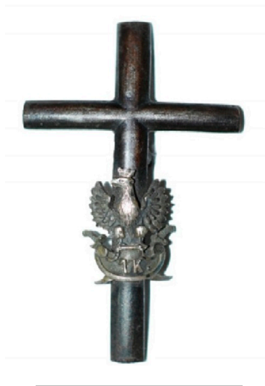
Krzyż Dowbora - odznaka pamiątkowa I Korpusu Polskiego.

W ten sposób budzono polską dumę wśród własnych żołnierzy i mieszkańców odległych ziem – mińskiej i mohylowskiej. Gdy waliła się w gruzy potęga Rosji, obecność I Korpusu Polskiego wielu mieszkańcom wydawała się spełnieniem marzeń o powrocie spadkobierców Stefana Batorego i Jana III Sobieskiego. Z kresowych dworów ciągnęły do I Korpusu zastępy pełnej patriotycznego zapału młodzieży