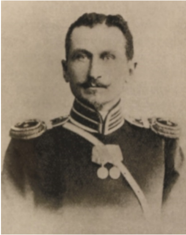
Porucznik Józef Dowbor-Muśnicki w okresie służby w 11. Pułku Grenadierów.

„Niejednokrotnie podziwiałem ich [Japończyków] sposób działania, zawsze przemyślany w szczegółach i konsekwentnie przeprowadzany. Osobiście jestem im wdzięczny, bo mając wtedy głowę dobrze naładowaną teorią, przerobiłem praktycznie wszystko to, czego się nauczyłem teoretycznie. Japończycy nauczyli mnie też, co można wydobyć z żołnierza. Służąc w szeregach armii rosyjskiej i poniósłszy wraz z nią porażkę, wykorzystałem swoje doświadczenia podczas wojny światowej”.