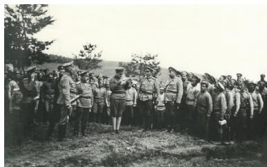
Aleksander Kiereński przed frontem XXXVIII Korpusu Armijnego w obecności gen. Józefa Dowbora-Muśnickiego i gen. Antona Denikina, 1917 r.

Mimo niezliczonych przeszkód kolejne oddziały polskie docierały stopniowo na miejsce koncentracji, ponosząc jednak duże straty. Odbывało się to bowiem w trudnych zimowych warunkach i wśród ciągłych walk z bolszewikami. W tym czasie liczebność korpusu spadła do ok. 12 tys. ludzi. Jednak nieprzyjacielowi nie udało się rozbić polskich jednostek, których morale okazało się nie do złamania. Stopniowo formował się front polsko-bolszewicki. 1. Dywizja Strzelców Polskich zajęła pozycje pod Rohaczowem, 2. Dywizja między Rohaczowem a Bobrujskiem, a 3. Dywizja znajdowała się w marszu z Jelni pod Smoleńskiem i dotarła do głównych sił kilka tygodni później, 3 marca 1918 r. W Dukorze pod Mińskiem stacjonował 1. Pułk Ułanów, który zabezpieczał teren koncentracji od zachodu.