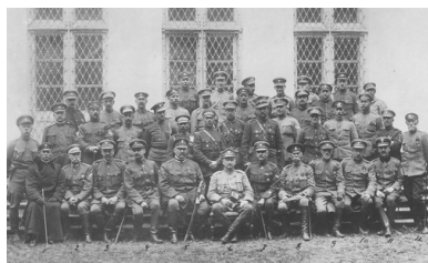
Dowódcy oddziałów I Korpusu Polskiego z generałem Józefem Dowborem-Muśnickim (siedzi 6. z lewej), Bobrujsk 1917 r.

A Maria Dąbrowska w swoich Dziennikach, choć nieco bardziej sceptyczna wobec informacji o sukcesach polskich wojsk na Wschodzie, również dawała upust swemu zachwytowi dla gen. Dowbora: „To, co robi Dowbór-Muśnicki, to jakby baśń historii”.