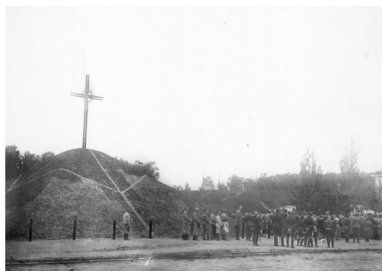
Poświęcenie kopca ku czci poległych żołnierzy I Korpusu Polskiego, 1918 r.

Nadszedł maj 1918 r. – w Bobrujsku odbywały się uroczyste obchody święta 3 Maja, będące pokazem siły i triumfu I Korpusu Polskiego. Podobne obchody zorganizowano także w innych miejscowościach, np. w Nowym Bychowie i Mohylewie. Małe państwko trwało już trzy miesiące. Ulicami miast kresowych defilowały tysiące żołnierzy i ułanów, paradowała artyleria i wozy pancerne, a na niebie przeleciały nawet polskie samoloty.