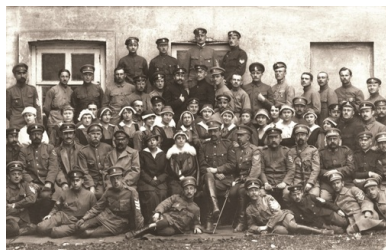
Lekarze, pielęgniarki i sanitariusze szpitala I Korpusu Polskiego w Bobrujsku.

powstawały zręby polskiej państwowości. Na terenach, gdzie panował dotąd rewolucyjny chaos, następowała stopniowa normalizacja, życie codzienne mieszkańców zaczęło się stabilizować i uspokajać, a gwarantem tego procesu był żołnierz I Korpusu Polskiego. Był to także gwarant suwerenności państewka bobrujskiego i spokoju jego mieszkańców. W Bobrujsku, oprócz polskiej prasy, szkół powszechnych i gimnazjum, rozpoczęły także działalność polski teatr, kooperatywa handlowa żołnierzy korpusu i wiele organizacji społecznych i młodzieżowych. Symbol normalizacji stanowiło także powstanie polskiej poczty, która wydawała własne znaczki. Zastąpiły one znaczki rosyjskie i wyparły je z obiegu. Znaczki polskie powstawały w wyniku nadrukowywania na rosyjskich orła jagiellońskiego i napisu: „Poczta Polowa Polskiego Korpusu”.