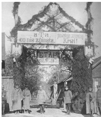
Jedna z bram wzniesionych w Bobrujsku z okazji święta 3 Maja w 1918 r.

Innym, w tym wypadku na poły konspiracyjnym wydawnictwem, które ukazywało się przy I Korpusie Polskim, było „Sumienie”. Pismo to, wydawane przez grupę piłsudczyków związanych z konspiracyjny „Związkiem Broni” i POW, redagowane przez Melchiora Wańkowicza, zaczęło się ukazywać na początku kwietnia 1918 r. Oficjalnie była to inicjatywa grupy oficerów I Korpusu, mająca charakter patriotyczny i apolityczny. Główny cel wydawnictwa stanowiło było jednak krytykowanie działań gen. Dowbora-Muśnickiego i podważanie wśród żołnierzy i oficerów zaufania do jego poczynań. Wyszły, jak się wydaje, jedynie dwa numery, w dość dużej jak na tego rodzaju wydawnictwo objętości 32 stron i w formacie broszury. Nie wiadomo, dlaczego nie ukazały się kolejne numery pisma.