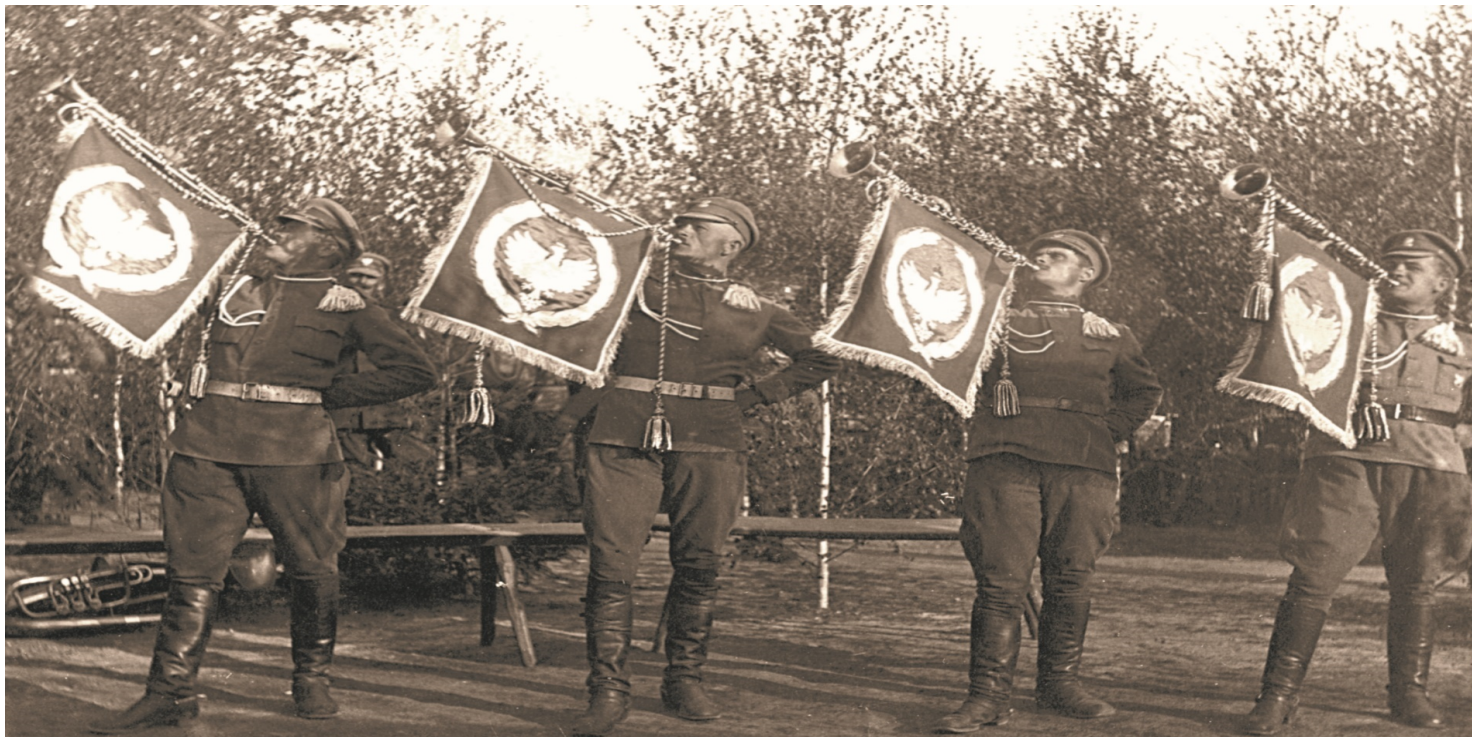
Trębacze i szwadron honorowy 1. Pułku Ułanów na uroczystościach 3 Maja w Bobrujsku, 1918 r. Fot. Wojskowe Biuro Historyczne

https://przystanekhistoria.pl/pa2/tematy/jozef-dowbor-musnicki/61755,Rzeczpospolita-Bobrujska-mala-Polska.html