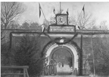
Brama wiodąca do twierdzy Bobrujsk udekorowana z okazji święta 3 Maja w 1918 r.

Jednak żeby można było myśleć poważnie o tych ambitnych planach, należało najpierw doprowadzić do koncentracji polskich oddziałów i o ich znacznej liczebnej rozbudowie, co odbywało się, jak wiadomo, w nieustannej walce z siłami bolszewickimi.