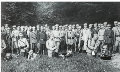
Żołnierze Legionu Wschodniego ćwiczą strzelanie z karabinów. Dublany k. Lwowa, lato 1914 r.