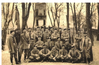
Członkowie Towarzystwa Gimnastycznego "Sokół" w mundurach galowych - czamarach i czapkach z sokolim piórem. Borszczów k. Tarnopola, 1906 r.

Armia austro-węgierska, w której czołowe stanowiska zajmowali austriaccy Niemcy, była instrumentem germanizowania żołnierzy innych narodowości wchodzących w skład cesarstwa – zetknął się z tym także młody Haller, który kilkakrotnie musiał wykazać się nieustępliwością wobec szykan przełożonych usiłujących zabraniać mu czytania polskich książek, pisania listów po polsku itp. Dzięki swej wrodzonej bezkompromisowości w sytuacjach, gdy czuł, że racja jest po jego stronie, wychodził zwycięsko z tych prób narodowego charakteru.