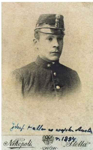
Józef Haller jako elew Wojskowej Akademii Technicznej w Wiedniu w 1894 r.