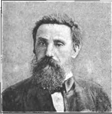
Portret Bolesława Limanowskiego z książki „Upominek. Książka zbiorowa na cześć Elizy Orzeszkowej (1866-1891)”

Oznaczało to wysunięcie na plan pierwszy postulatu walki o niepodległość.